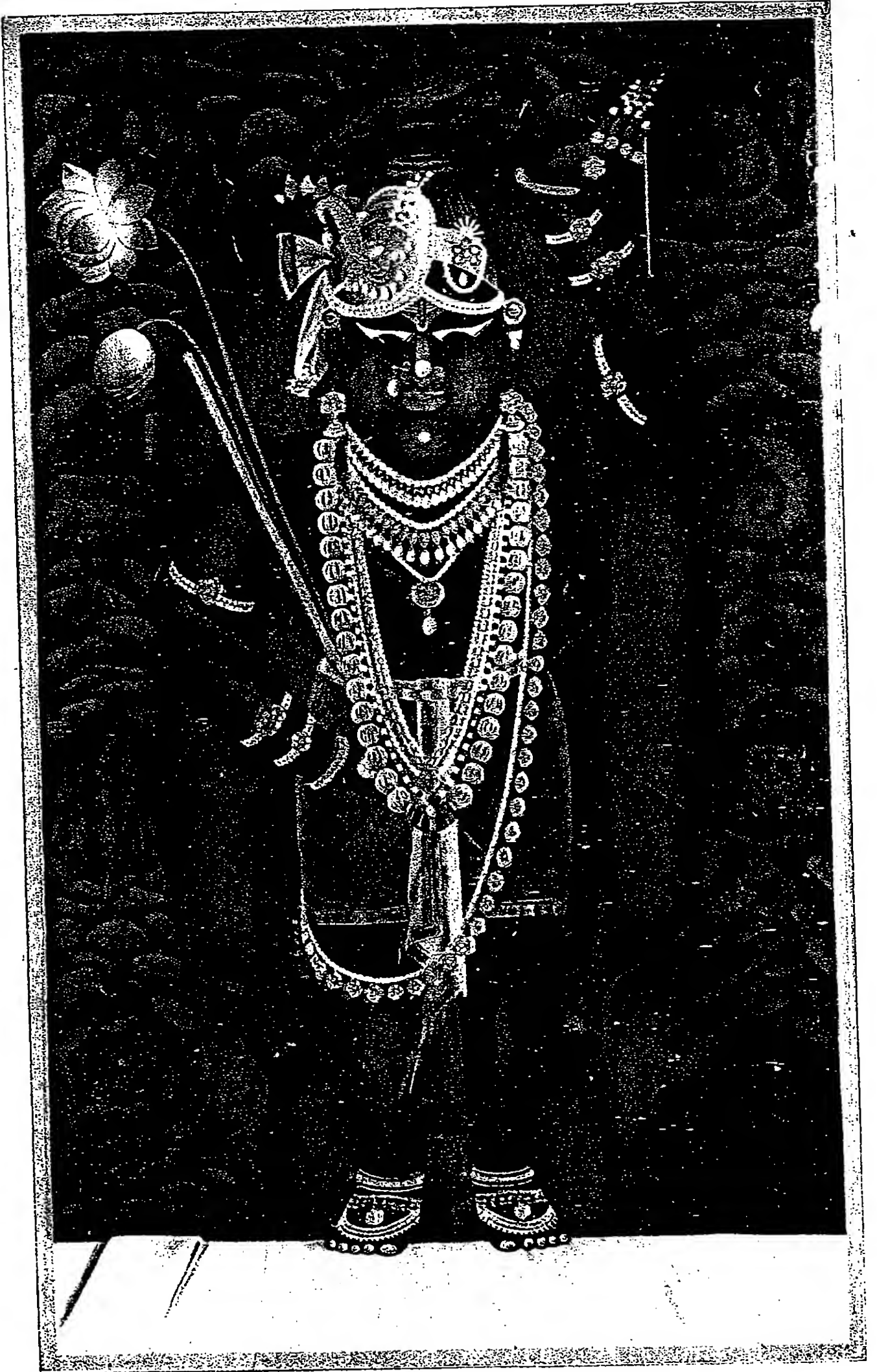
श्री गोवर्धननाथजी पाटोत्सव • गुर्जर • माघ वदि ९